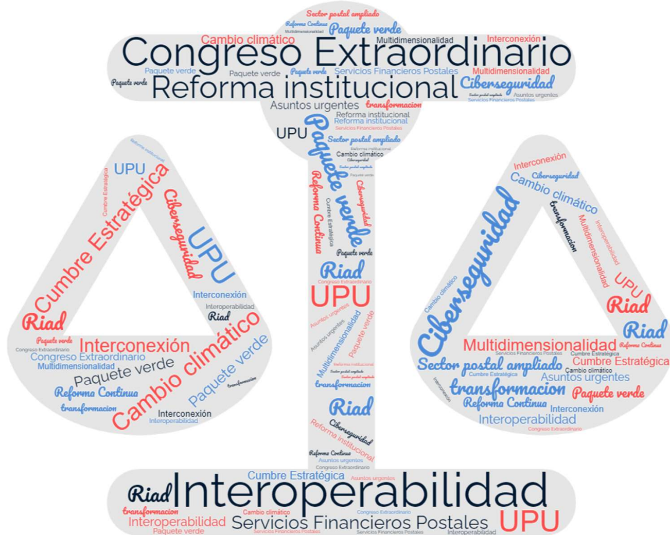
Conclusiones del 4to Congreso Extraordinario de UPU